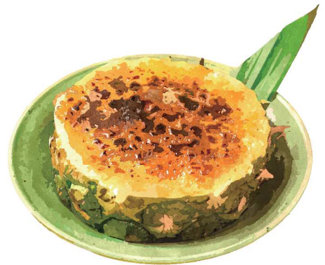
Pineapple Creme Brulee

[おすすめトッピング:ココナッツアイス ¥150] Topping : Coconut Ice Cream